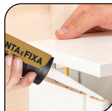
Montagem de Móveis