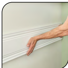
Painel de Madeira