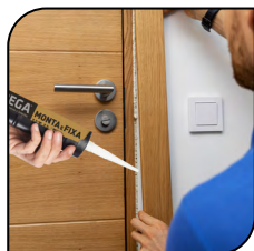
Guarnição de Móveis