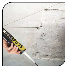
Junta de piso