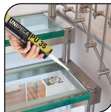
Escada de Alumínio