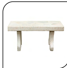
Alvenaria e Concreto