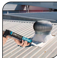
Sistema de Ventilação Industrial