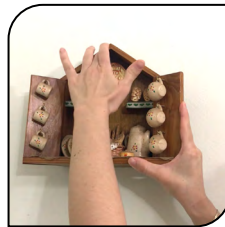
Objeto de Decoración