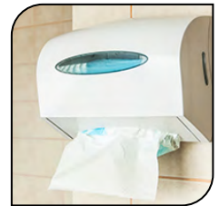
Soporte de Papel