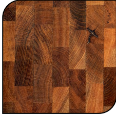
Taco de Madera