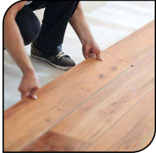
Laminado de Madera