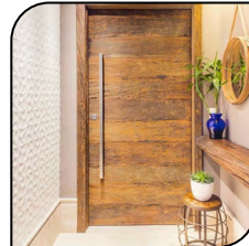
Puerta Madera de Demolición