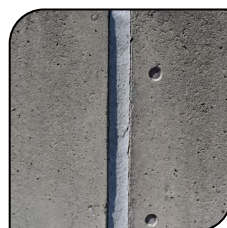
Junta de Dilatação