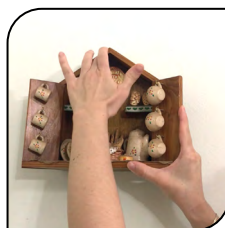
Objeto de Decoração