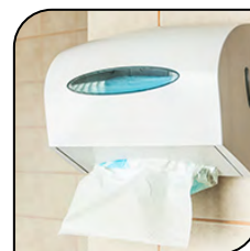
Suporte de Papel