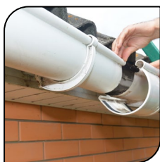
Calha e rufo