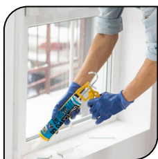
Porta e janela